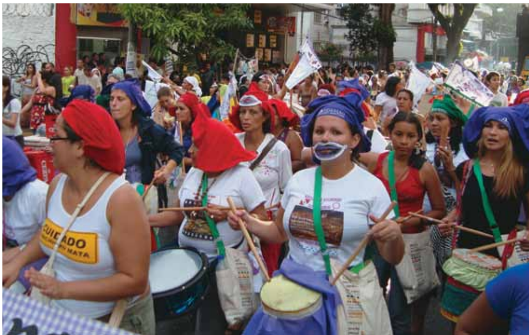
Mulheres contra o fundamentalismo religioso durante o Fórum Social Mundial, em 2009